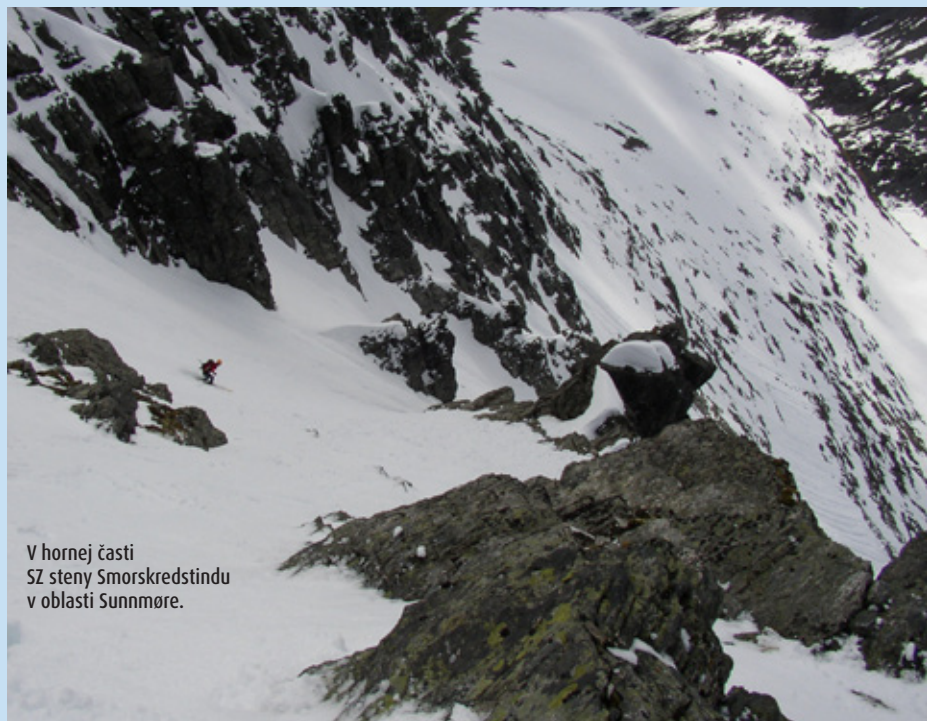
V hornej časti SZ steny Smørskredstindu v oblasti Sunnmøre.

„Domov obrov“ je sídlom najvyšších nórskejších vrcholov, pričom hory tu majú zase o niečo iný ráz oproti vyššie spomínaným oblastiam. Typické sú dlhé, široké doliny a kopce, ktoré tvarom trochu pripomínajú Západné Tatry. Nie sú teda také dychberúce ako povedzme Sunnmøre, ale majú svoje čaro a rozhodne sa sem oplatí prísť pozrieť. Najpopulárnejším vrcholom je Galdhøpiggen (2469 m), ktorý je