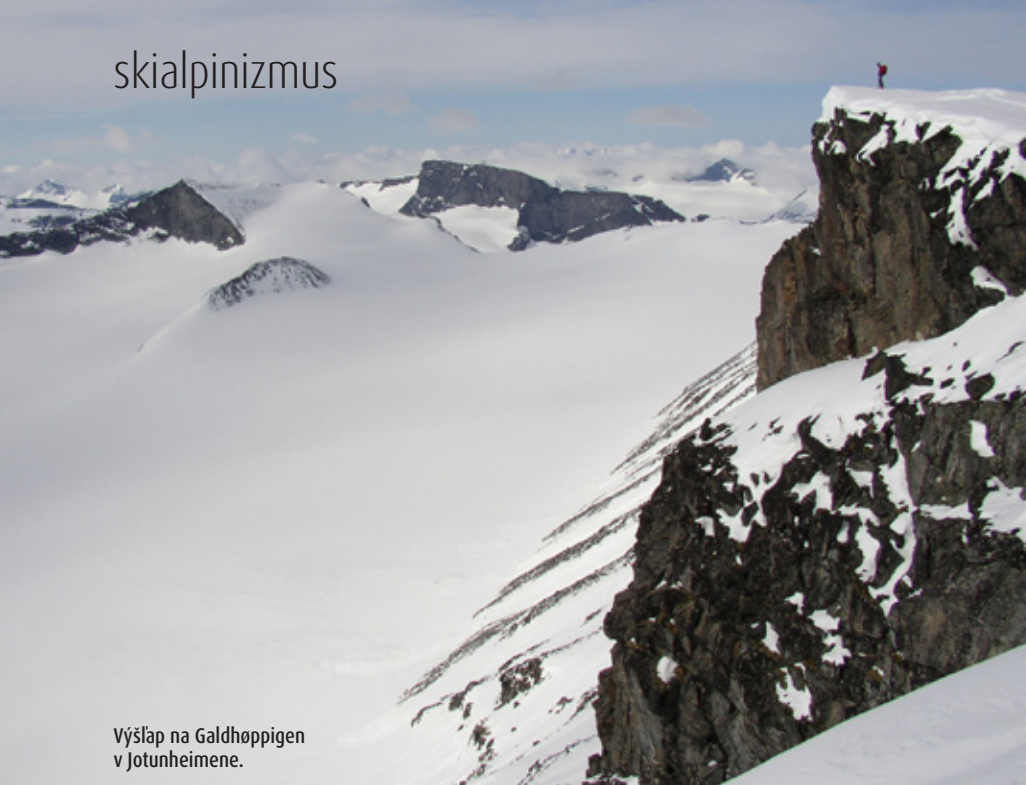
Výšlap na Galdhøppigen v Jotunheimene.

Ak sa do oblasti Romsdalu dostane koncom mája, určite nevynechajte lyžovačku v horách okolo cesty Trollstigen, ktorú zvyknú po zimnej sezóne otvárať posledný májový víkend (záleží od zimy – toho roku komplikoval otvorenie cesty obrovský kus ľadu visiaci nad cestou). Autom sa grátis vyveziete až do výšky 700 – 800 metrov, odkiaľ ešte i začiatkom júna bežne stačí len vystúpiť z vozidla, zapnúť lyže a začať stúpať na niektorý z okolitých kopcov. Medzi najpopulárnejšie patrí Finnan, Alnestinden či Breitinden (1797 m).