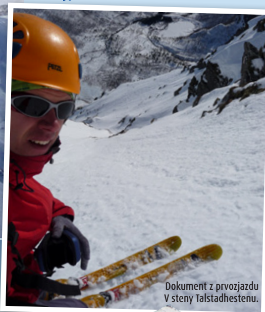
Dokument z prvozjazdu V steny Talstadhestenu.