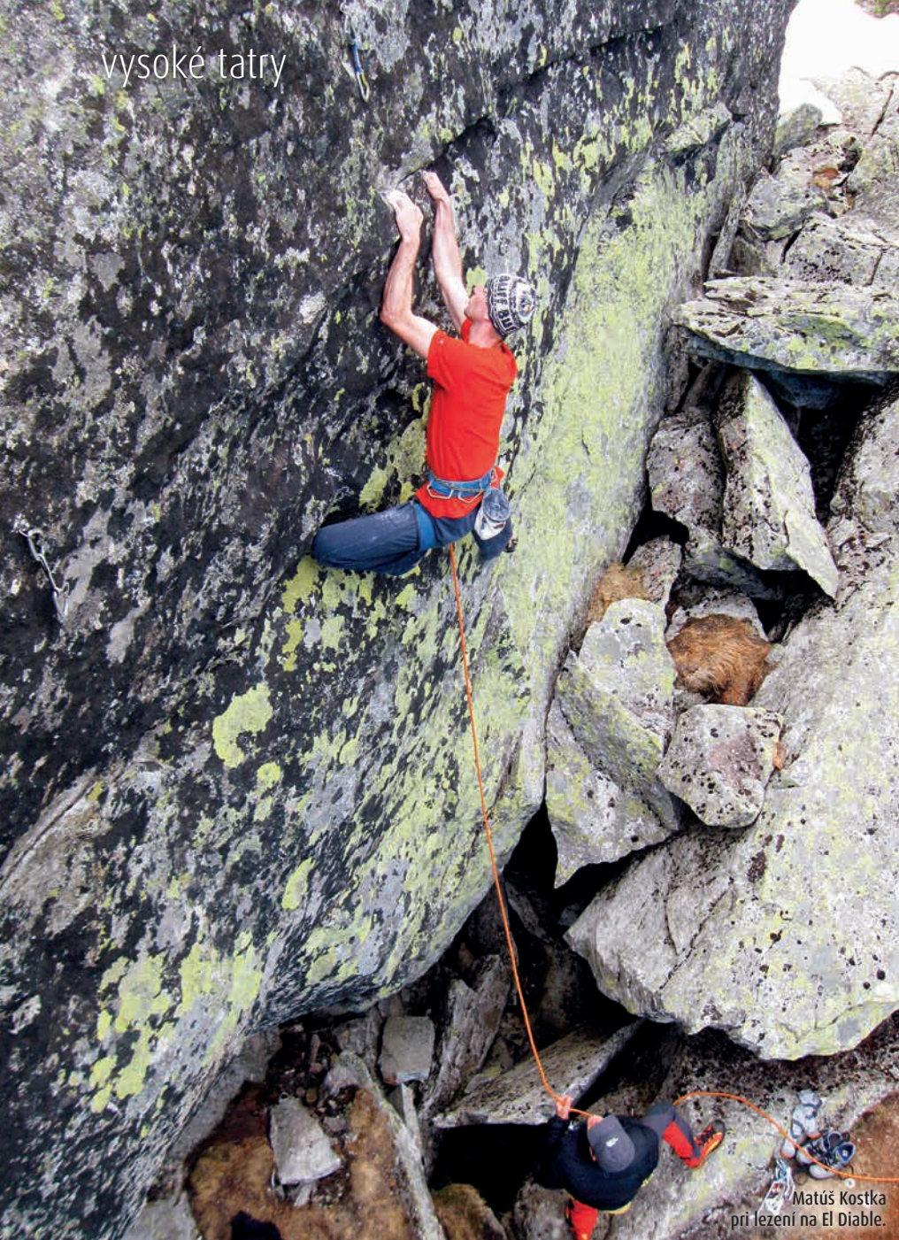
Matúš Kostka pri lezení na El Diabla.