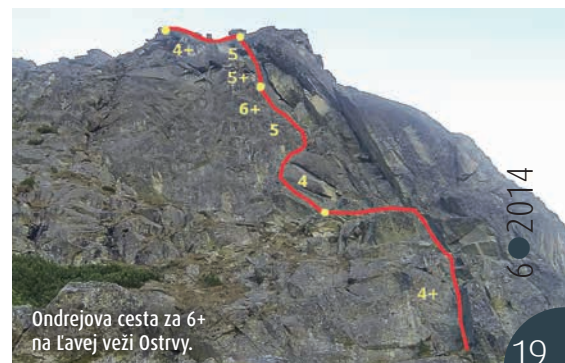
Ondrejova cesta za 6+ na Lavej veži Ostrvy.