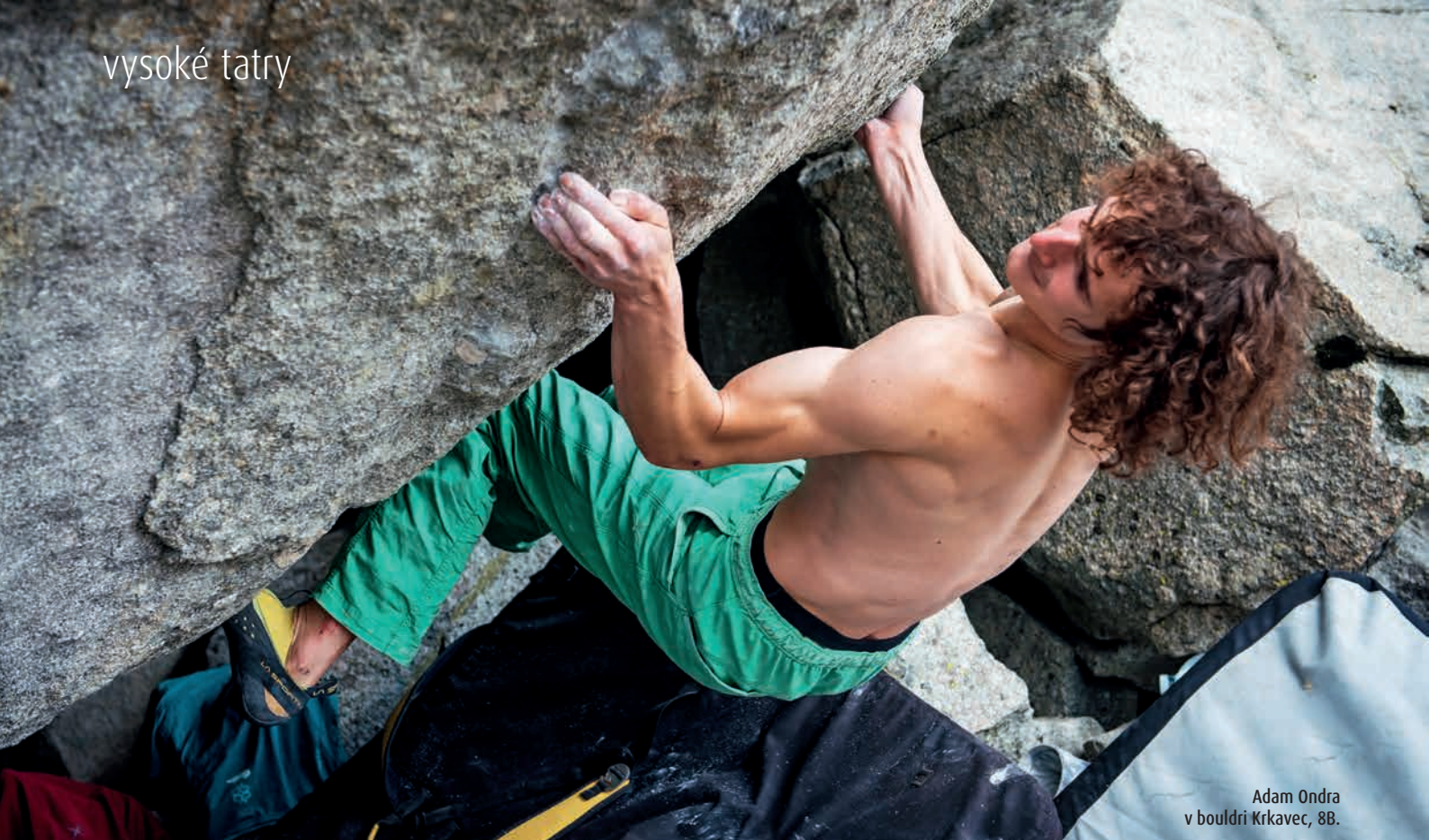
Adam Ondra v bouldri Krkavec, 8B.