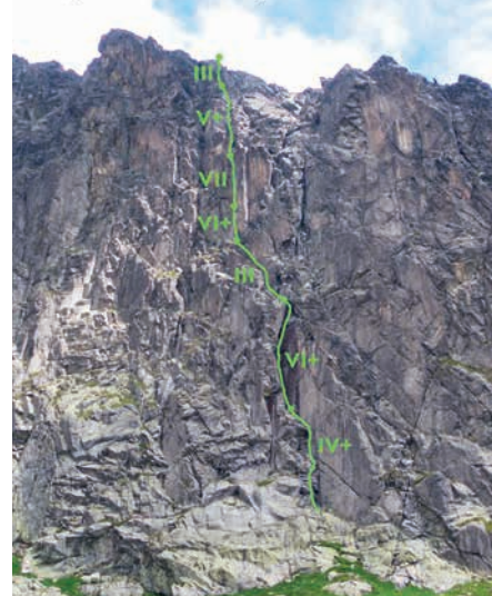
Javorový štít - JZ stena "Kajšmentke" VII, Kořínek Staroň