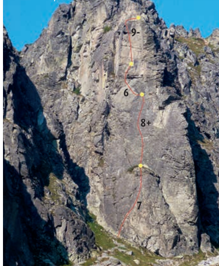
Predné Solisko, cesta Kant, 9-.