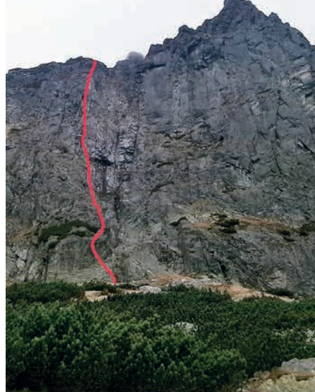
Cesta Satanove slzy, 6-, v Galérii Satana.