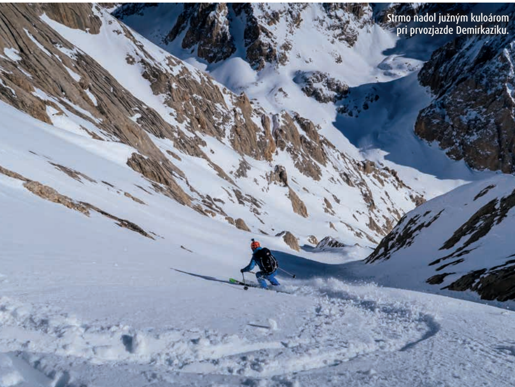
Strmo nadol južným kuloárom pri prvozjazde Demirkaziku.

vidieť masív sopky Erciyes, kde sme pred pár dňami začínali. Na druhej strane je učupený kuloár Yasemin, odkiaľ sa nám predvčerom prvýkrát v plnej kráse ukázal Demirkazik. Ďalej na juhu vidieť ďalšie dominanty pohoria Aladaglar – najvyššie štítu Kizilkaya, Emler, Kaldi. Náhhera! Slnecná atmosféra hôr ma vždy dokáže nabiť mentálnou energiou potrebnou pre náročný zjazd. Na dlhé rozjímanie však nie je čas. Máme časový sklz a musíme sa pustiť dole čo najskôr dúfajúc, že v kľúčovej spodnej pasáži ešte nezašlo slnko a nestihla sa tam spraviť kôra.