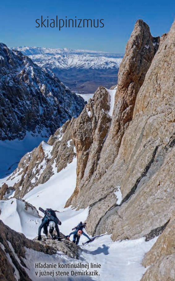
Hľadanie kontinuálnej línie v južnej stene Demirkazik.