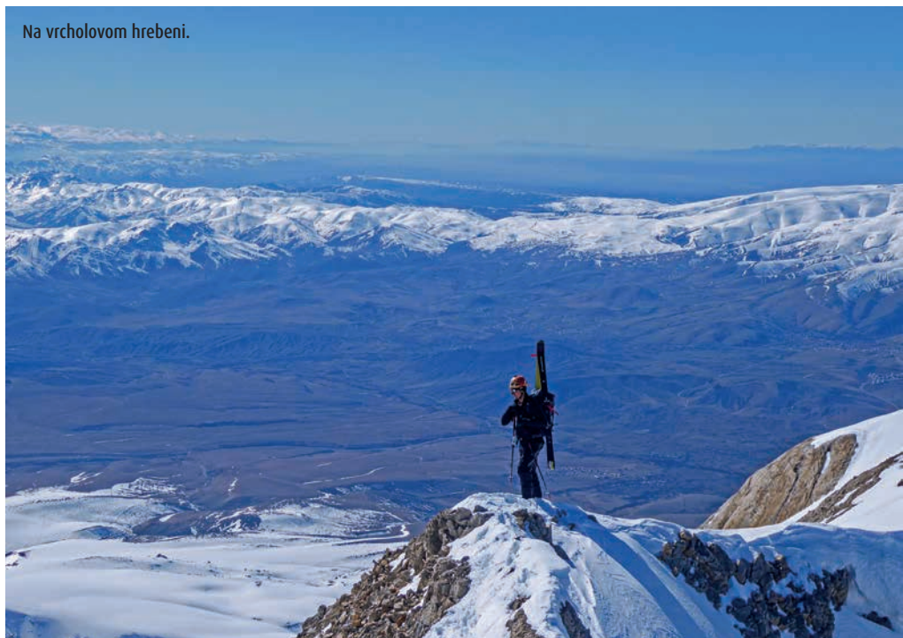
Na vrcholovom hrebeni.

Nechávam myšlienky na zjazd bokom a vychutnávam si lahodnú chuť novej Snehanky od Marvy. Dobré to ten Vardži pečie! Popri chrúmaní tyčinky si užívam krásne výhľady na všetky svetové strany... Na severe