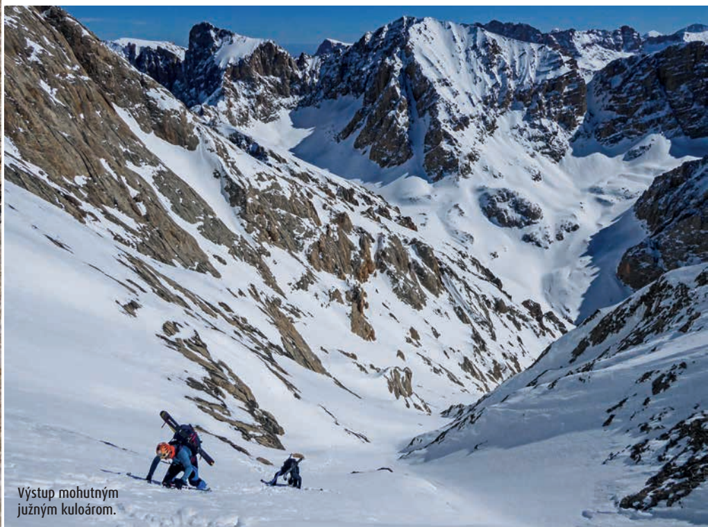
Výstup mohutným južným kuloárom.

do doliny celú na lyžiach, bez nutnosti zlaňovania alebo zliezania pešo. Pre mňa extrémne lyžovanie vždy bolo a bude predovšetkým o lyžovaní. Nie o zlaňovaní, pridržaní sa fixného lana či zliezaní. Zlaniť sa dá s potrebnou výzbrojou takmer všetko, zlyžovať nie. Hľadanie pekných štítov s možnosťou lyžovania esteticky zaujímavých línií z ich vrcholov kontinuálnym spôsobom je jedným z faktorov, ktoré sú pre mňa pri skialpinizme dôležité. O to viac ma teší, že sme na Demirkaziku takúto líniu našli. No ešte nie sme hore. Uvidíme, čo nás čaká vyššie.