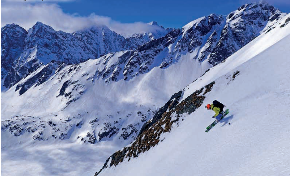
Firnová lyžovačka na Mengusovských štítach.

možnosť objavovať línie, ktoré predtým neboli zlyžované. Išlo o kopce, ktoré som nepoznal a do ktorých bol komplikovaný prístup. Často to pre mňa v praxi znamenalo nočné vstávanie, trajekt, bajkovačku popri fjorde s lyžami na chrbte, dlhý deň osamote v kopcoch a to isté naspäť. Niekedy aj tri dni za sebou bez oddychu. Doteraz si dobre spomínam, ako mi pri jednej z takýchto túr v Tresfjorde došlo jedlo a vyčerpaný som mal pocit, že naspäť na trajekt to už nedobajkujem. Že budem musieť ísť pýtať jedlo do niektorého z roztrúsených domov na pobreží