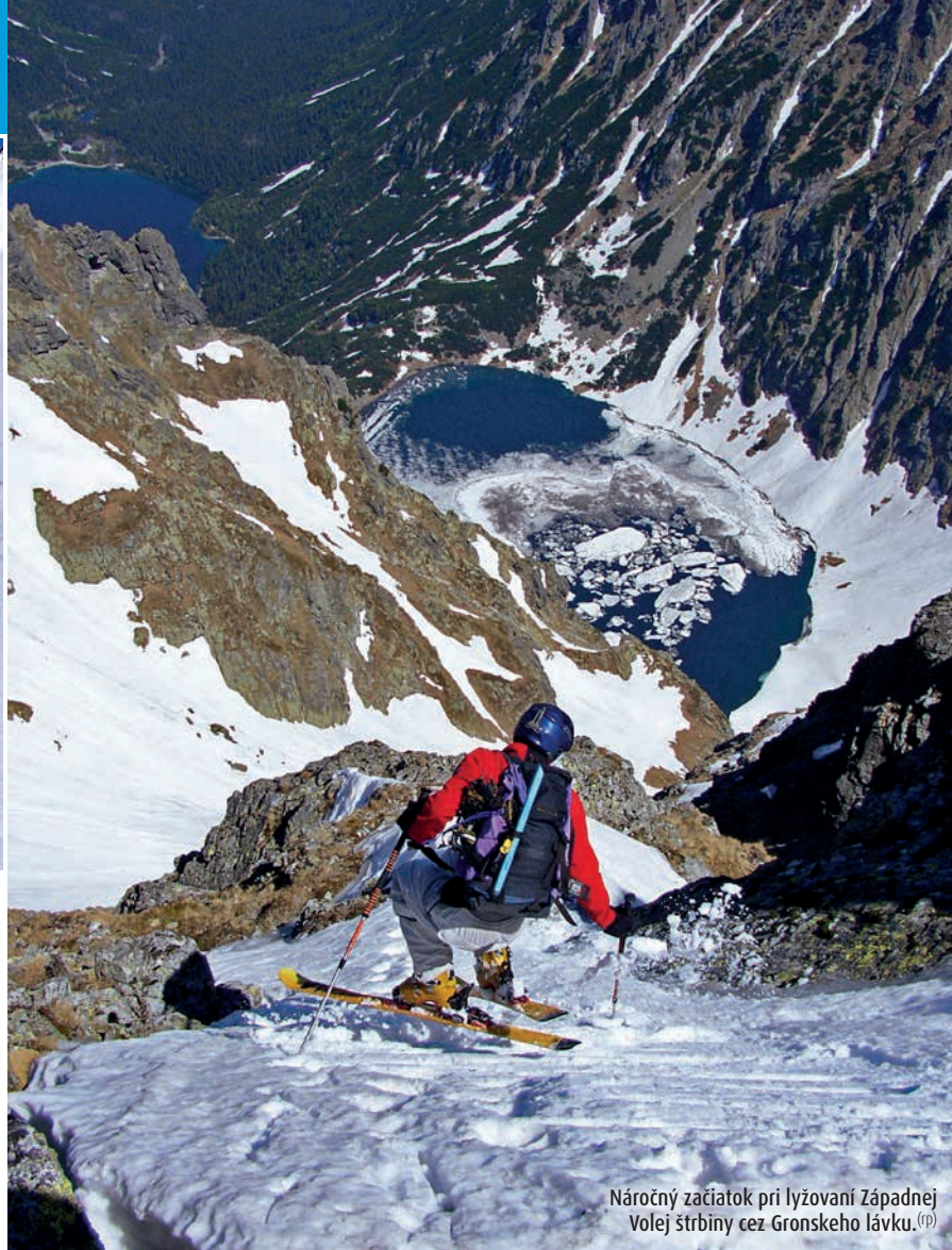
Náročný začiatok pri lyžovaní Západnej Volej štrbiny cez Gronského lávku. (mp)