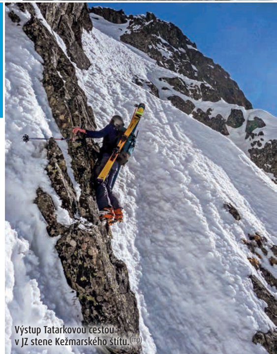
Výstup Tatarokovou cestou v JZ stene Kežmarského štítu. (20)

Tradičný skialpinizmus v spojení s extrémnym lyžovaním považujem za najkrajší horský šport. Možno ani nie šport, skôr životnú filozofiu, životný štýl, ktorý napriek všetkým rizikám prináša do môjho života veľa pozitívnych zážitkov a skúseností. Do tajov lyžovania strmých žlabov ma zasvätil môj otec, s ktorým som už ako sedemročný fagan na prvom stupni základnej školy začal brázditiť žlaby na Chopku. Najskôr klasiky ako Dievčenský, Školský, Meteorologický, Retranslačný, neskôr postupne strmšie žlaby v stredných a zadných Derešoch. V tom čase nebol na Chopku žiadny luxusný funitel, len stará dvojsedačka, ktorej trvalo takmer polhodinu, kým vytiahla svojich pasažierov z Lukovej na Chopok. V žlaboch bolo minimum ľudí. Lyžovačka mala pre mňa čaro objavovania nepoznaného, ktoré som ako dieťa