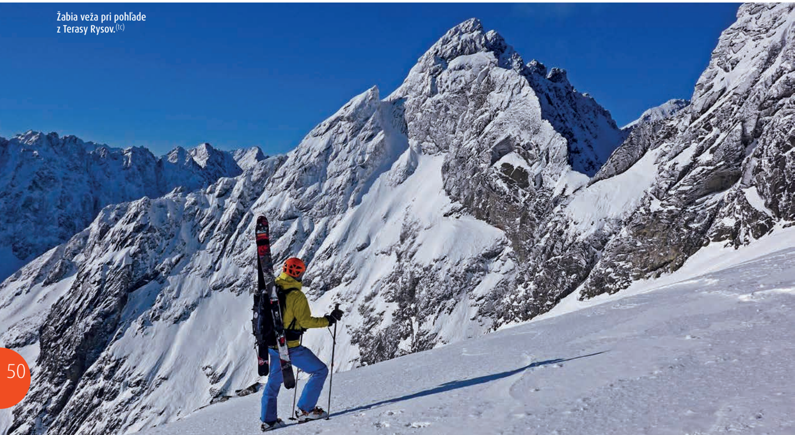
Žabia veža pri pohľade z Terasy Rysov.

fjordu a potom túžobne čakať na blahodarný vplyv sacharidov. Úžasné dobrodružstvá a neoceniteľné skúsenosti do ďalšieho života. Napriek tomu, že som v romsdalských kopcoch fungoval bez partáka a bez auta, podarilo sa mi tam polyžovať množstvo krásnych strmých línií v dychberúcich scenériách nórskej prírody. Prvojazd východnej steny Sunnmorslauparlaegdy doposiaľ považujem za jednu z najkrajších a najťažších línií, akú som kedy lyžoval. Dokonca aj domáci ju stále pokladajú za najnáročnejšiu kontinuálnu lyžiarsku líniu v oblasti Romsdalu a vraj aj za