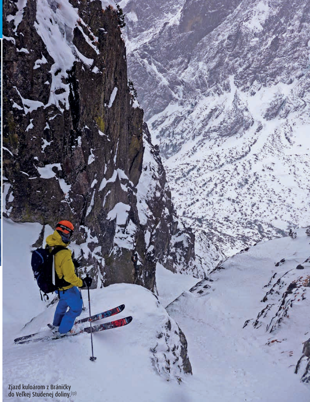
Zjazd kuloárom z Bráničky do Veľkej Studenej doliny.