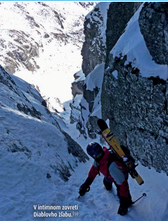
V intímnom zovretí Diabľovho žľabu. (P)