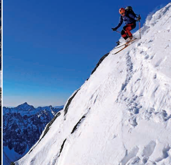
Strmé preskoky z vrchola Ťažkého štítu do Dračej dolinky.