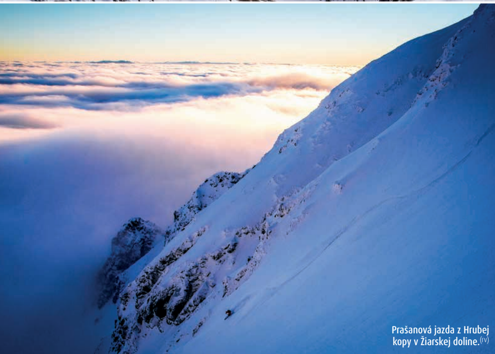
Prašanová jazda z Hrubej kopy v žiarskej doline. (v)