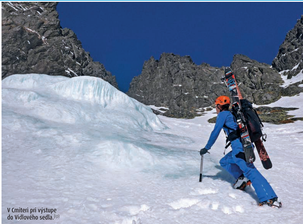
V Cmiteri pri výstupe do Vidlového sedla. (p)