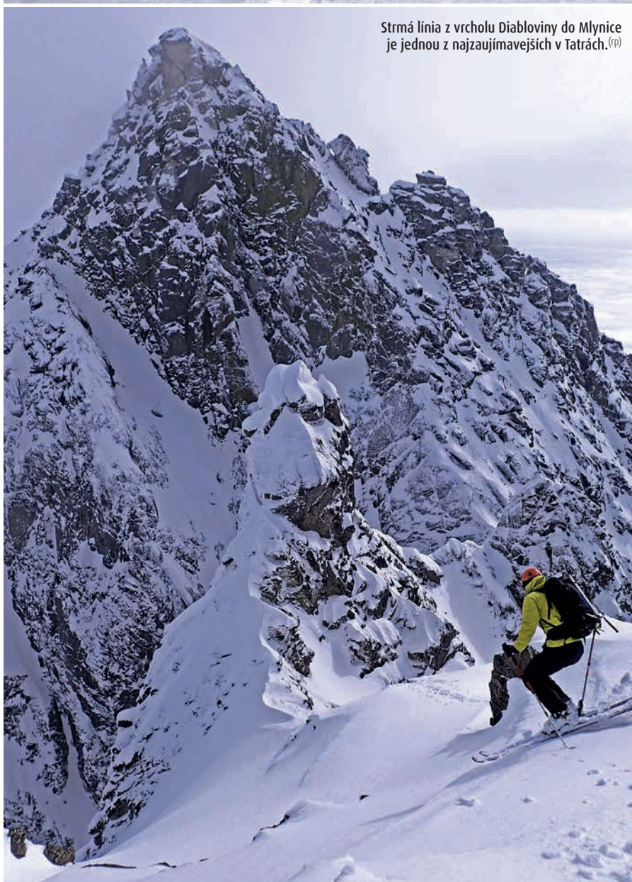
Strmá línia z vrcholu Diabloveiny do Mlynice je jednou z najzaujímavejších v Tatrách. (p)