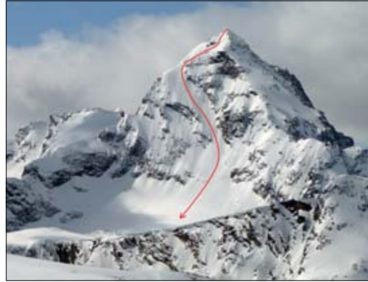
Østveggen på Store Vengetind: «Slingsbyruta». 40–50 grader med en seksjon 55 grader. Samme dag kjørte Miroslav også Nordryggen («normalvegen») på Store Vengetind. Ryggen til høyre for Slingsbyruta.