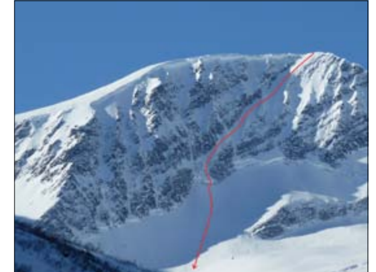
Sandfjellet, østveggen: På Måndalen-sida av fjellet ned mot Kvassetindvatnet. Start med traverserende linje 40–45 grader, deretter 50–55 grader.