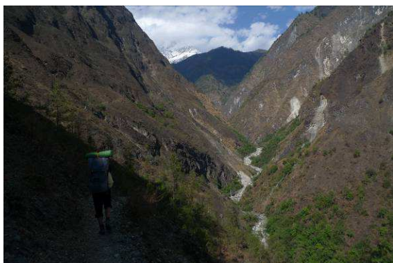
Prvý deň treku

Trek okolo Dhaulághirí je výnimočný – pretína ohromujúce priesmyky, ponúka úchvatné výhľady na osemtisícové vrcholy Annapurien, Dhaulágirí, Tukuche a na mnohé ďalšie vysoké vrcholy. Trek čiastočne prechádza kaňonom Kali Gandaki, ktorý je považovaný za najhlbší na Zemi. Prejdete typickými dedinami Gurungů a ďalších etník typických pre túto oblasť. Najvyšší položený nocľah v Hidden Valley (5050 m) je na mieste, ktoré zo všetkých strán lemujú dychberúce výhľady – obzor lemuje Tukuche West, Dhaulághirí, Sita Chuchura a Dhampus Peak. Dovidíte až do bájneho a mystického kráľovstva Mustangu a ochutnáte najšľavnatejšie jablká na svete. Najvyšším bodom treku je French Pass, 5360 m.