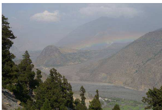
Návrat späť do civilizácie