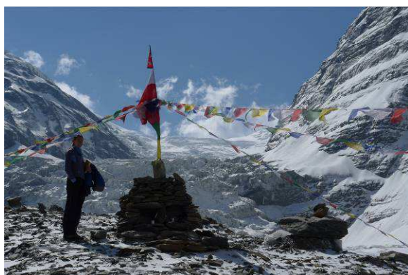
Základný tábor pod Dhaulágirí