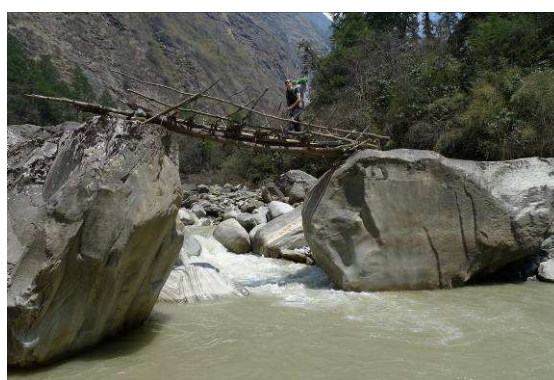
Druhý deň treku